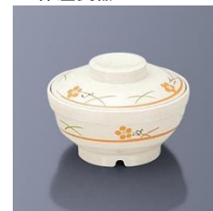
BHK-6001 YUK 小鉢 118×60・235ml ¥2,780 BHK-6011 YUK 小鉢蓋 111×30 ¥2,440