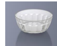
CB-88 AQC 小鉢 100×40・200ml ¥650