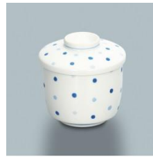
KB-887 MZB 茶碗蒸し 69×60・155ml ¥980 KF-888 MZB 茶碗蒸し蓋 76×20 ¥720