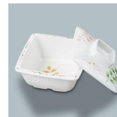
MB-336 HNE 角小鉢 102×102×46・220ml ¥920 MB-337 HNE 角小鉢蓋 95×95×26 ¥770