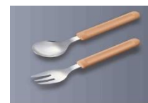
48SP BR スプーン 175mm ¥470 47FO BR フォーク 175mm ¥470