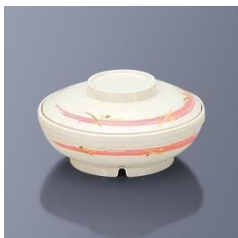
BHK-6007 FUP 煮物椀 160×53・400ml ¥3,240 BHK-6077 FUP 煮物椀蓋 151×32 ¥2,900