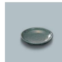
MS-648 WT 和皿 100×19 ¥320