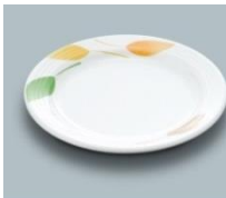
MS-526 HNE パン皿 169×17 ¥830