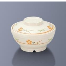
BHK-6005 YUK 飯椀 136×67・330ml ¥2,900 BHK-6055 YUK 飯椀蓋 125×33 ¥2,550