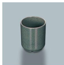
MC-832 WT 切立湯呑 68×77・190ml ¥430