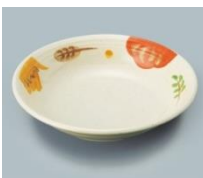
MS-566 CAR クープ皿 190×40・610ml ¥900