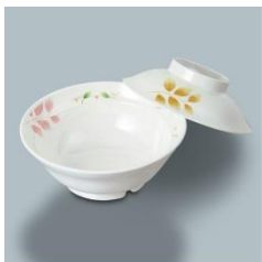
MB-673 HNE 煮物椀 135×52・360ml ¥980 MB-607 HNE 煮物椀蓋 117×33 ¥570