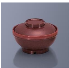
BHK-6005 TUS 飯椀 136×67・330ml ¥2,550 BHK-6055 TUS 飯椀蓋 125×33 ¥2,320