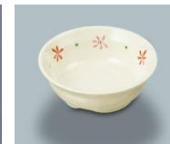
MB-632 HKK 小鉢 105×37・160ml ¥700